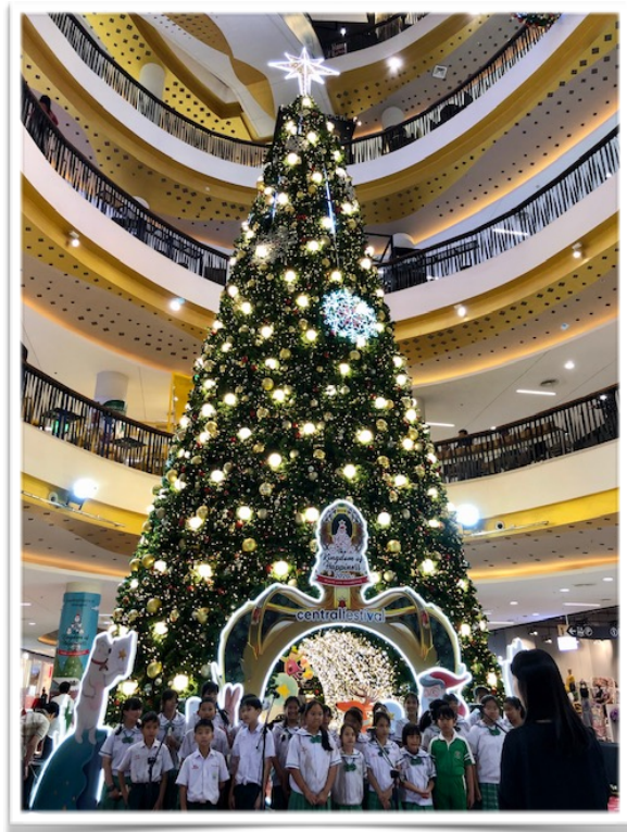
Kristillisen koulun oppilaat lauloivat joululauluja uudessa ostoskeskuksessa.